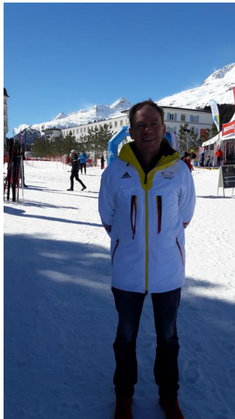
StartNr-Ausgabe in St. Moritz